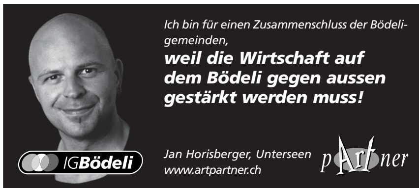
3) Persönliches Testimonial-Inserat CHF 210.–