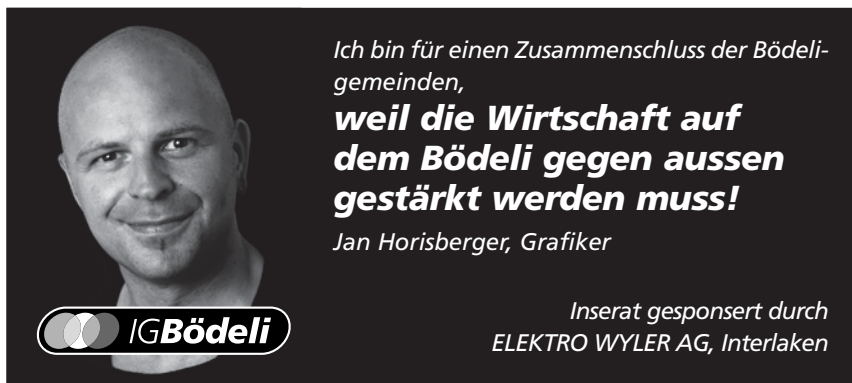
2) Testimonial-Inserat (namentlich als Sponsor erwähnt) CHF 160.–